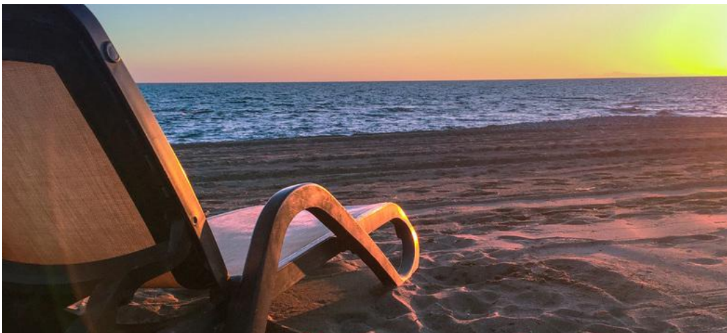
Seniorinnen und Senioren können an den Ökumenischen Nachmittagen 60+ ein paar abwechslungsreiche Stunden verbringen.