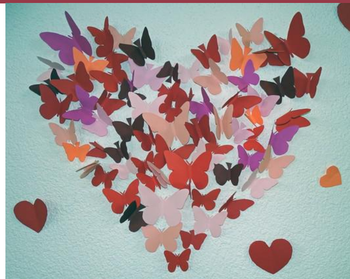
Ausschnitt Dekoration Konfirmation 12.5.2024.