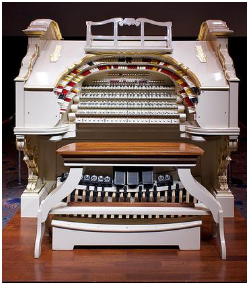
Eine Wurlitzer-Kinoorgel, extra für die Begleitung von Stummfilmen und zum Spiel von Tanz- Unterhaltungsmusik geschaffen.

Am 2. März wird die Kirche zum Kino-Saal: Die noch «tonlosen» Filme wurden früher von Pianisten, Organisten oder sogar grossen Orchestern begleitet. In Rückbesinnung auf die alte