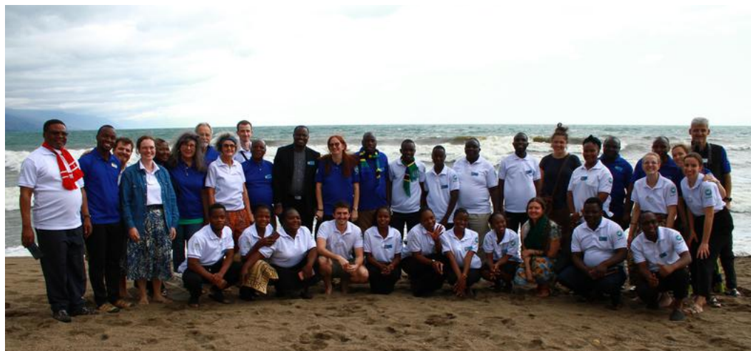
Die St. Galler Gruppe besuchte die Moravian Church in Mbeya und gewann Einblicke in verschiedene Projekte.