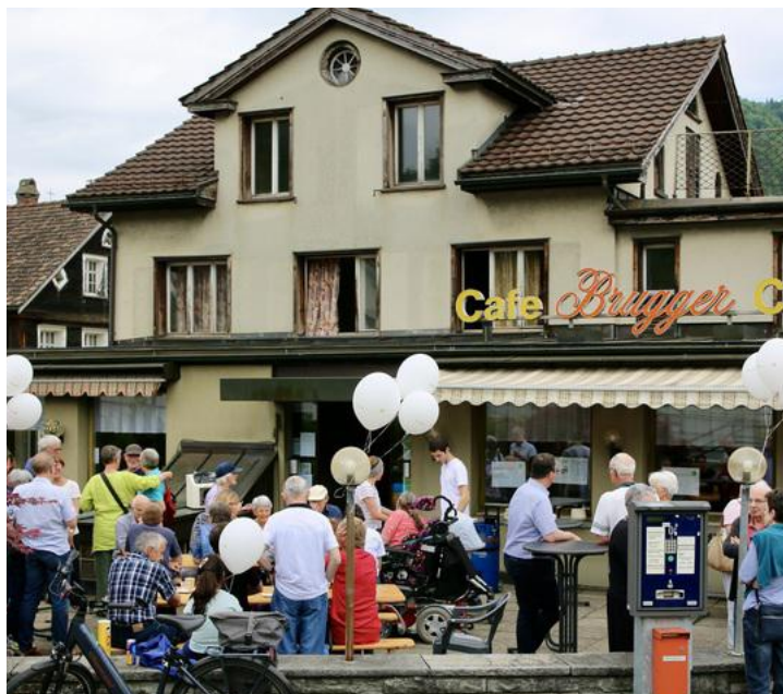
Der b'treff in Bahnhofsnahe in Wattwil: Eindrücke von der Eröffnung im Mai 2022.

Wesentlicher Teil des Erfolgsrezeptes des b'treff wattwil ist der zentrale Ort. Das ehemalige Café Brugger an der Bahnhofstrasse 10 ist mit seinen Räumen sehr geeignet für den Betrieb. Zum Angebot gehören beispielsweise die