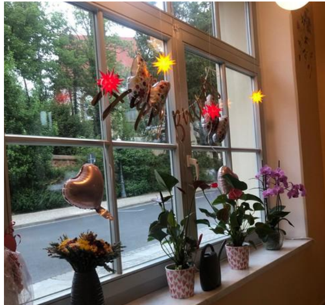
Café Rosengarten in Zittau.