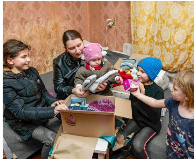
Eine aus der Ukraine geflüchtete Mutter mit ihren Kindern.

Weite Distanzen oder spezielle Auflagen er-