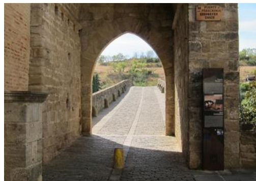
Puerta la Reina E (R. Wuillemin)

Donnerstag, 5. September 2024: Lichtensteig: Vogelherd-Runde