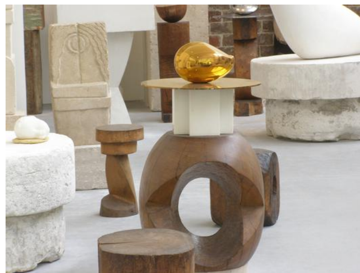
Kopf eines schlafenden Kindes / Brâncusi.