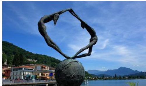
Die Erlebniswoche wird 2024 im schönen Tessin durchgeführt.