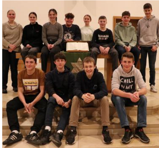
Links die Konfirmandengruppe vom 5. Mai in Lichtensteig und rechts die Konfirmandengruppe vom 12. Mai in Wattwil.