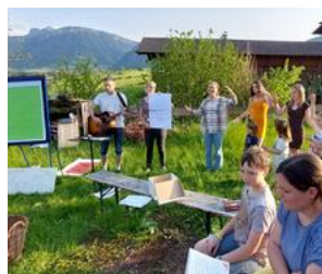
Den Glauben lebendig machen.

Detailinfos und Anmeldung unter: www.ref-sg.ch/familycamp