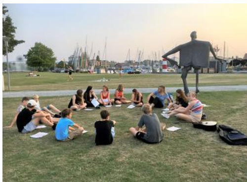
Spiel, Spass und Ausflüge stehen im TeensCamp in Stein am Rhein SH im Vordergrund. Die Anmeldefrist läuft.

In der ersten Sommerferienwoche vom Sonntag, 7. Juli bis Freitag, 12. Juli 2024, findet in der Jugendherberge Stein am Rhein unser diesjähriges TeensCamp statt. Angesprochen sind alle Teens, die ab August 2024 in der 1. bis 3. Oberstufe sind. Euch erwartet Spiel, Spass, Abenteuer, gute Gemeinschaft und Ausflüge. Direkt am Rhein werden wir eine abwechslungsreiche Woche mit einem spannenden Programm zum Thema «Wie en Fisch im Wasser» erleben. Eine aussergewöhnliche Übernachtung in einer Kirche wird dabei sein und auch ein Ausflug nach Konstanz ist geplant. Hast Du Lust, mit dabei zu sein? Infos und Anmeldungen liegen in unserer Kirche auf. Kontakt bei Fragen jederzeit: Thomas Faes, Jugendarbeiter, Mobile 079 280 68 90 oder Mail: thomas.faes@ref-mtg.ch