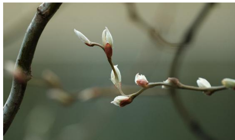
Im März besteht die Möglichkeit mit unserem Angebot «Pilgerpfade des Glaubens» den Frühling des Glaubens zu spüren.

können auch wir in unserem Glauben und unserer Spiritualität neue Wege beschreiten.