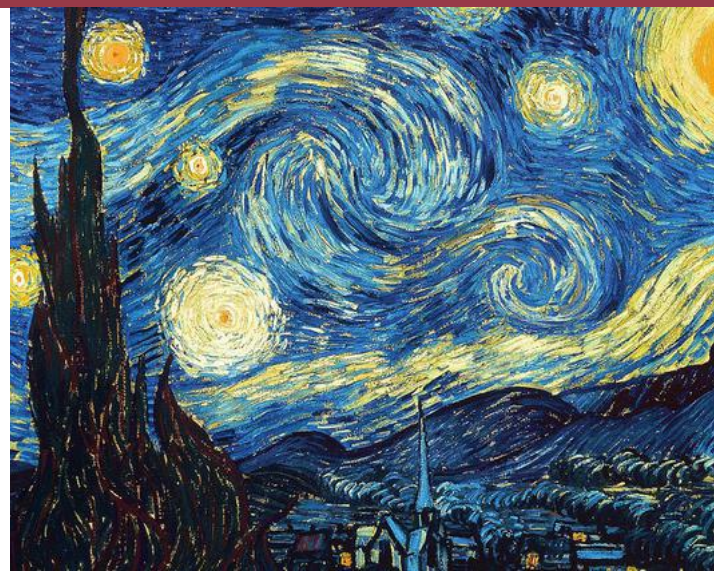
Vincent van Goghs Sternennacht lässt den tief menschlichen Hintergrund des Malers erahnen.

Der niederländische Maler Vincent van Gogh (1853–1890) besuchte vor seinem Beginn als Maler ein Seminar für Laienprediger in Brüssel und war kurzzeitig Hilfsprediger in der Gegend von einem belgischen Steinkohlerevier, wo die Menschen unter besonders harten Bedingungen lebten. Er verschenkte Kleidungsstücke und lebte in ärmlichsten Verhältnissen. Später als Maler prägte er den Satz: «Es gibt nichts Künstlerischeres, als Menschen zu lieben.» Nur schon diese wenigen Hinweise geben einem van Gogh-Bild einen tief menschlichen Hintergrund, und man beginnt zu ahnen, dass es ihm wohl um mehr ging als nur Farbe zu verstreichen. Eines seiner schönsten