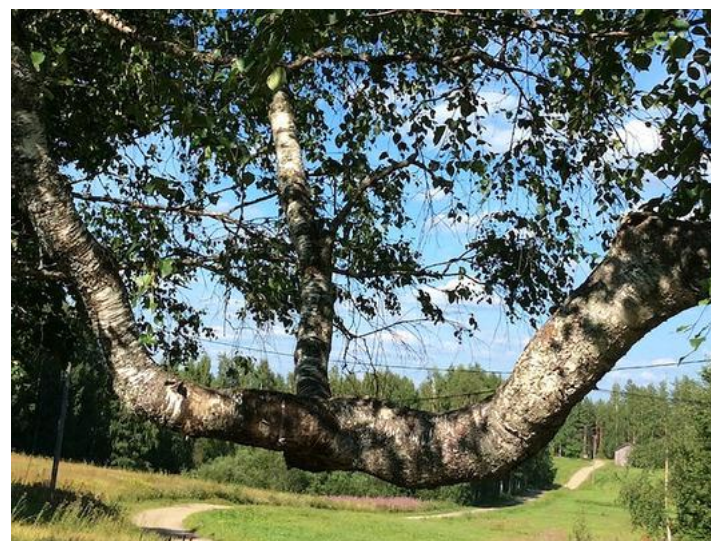
Finnische Birke mit dem Zeichen des hebräischen «Schin».