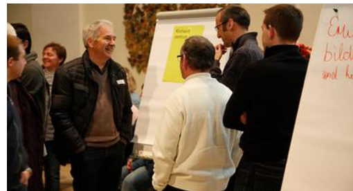
Die Kirchgemeinde möchte die Gelegenheit nutzen, zu informieren und in Kontakt zu Ihnen stehen.

Präsident Evang.-ref. Kirchgemeinde Mittleres Toggenburg