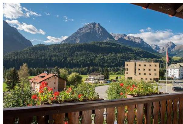
Das Hotel bietet einen wunderschönen Ausblick.

Wir beginnen jeden Tag mit einer Andacht. Nach dem Frühstück werden unterschiedliche Aktivitäten angeboten. Während es die Einen