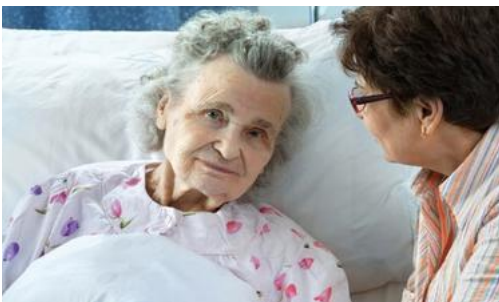
Angehörige in der letzten Lebensphase begleiten, birgt viele emotionale Unsicherheiten.

Der Grundkurs «Begleitung in der letzten Lebensphase» bietet Ihnen eine gute Gelegenheit, sich vertieft mit Sterben und Tod auseinanderzusetzen.