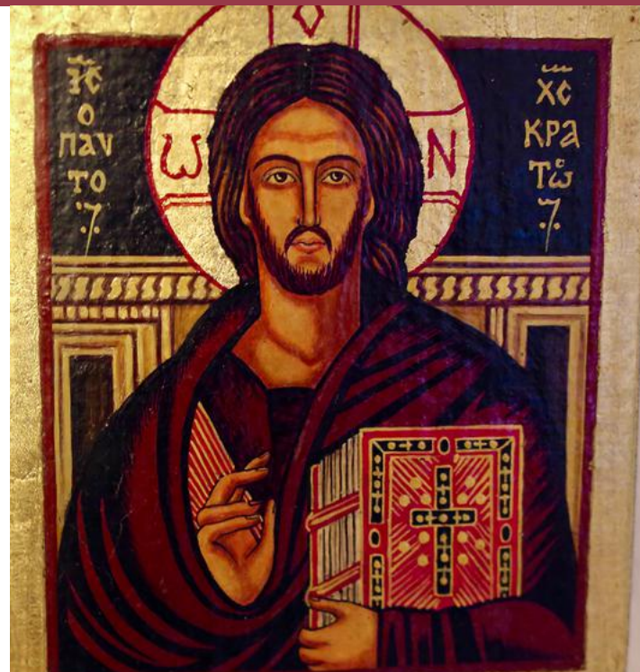
Christus in der Tradition der Ostkirche: Der Auferstandene auf einer üblichen Ikonendarstellung.

Und es ist eine Osterarbeit. Denn mit Karfreitag und Ostern kommt Gott ein für allemal mit uns Menschen mit durch alles, was einem in diesem Leben geschehen kann. Das hat er bei Jesus, dem von Gott gesalbten Menschen, getan.