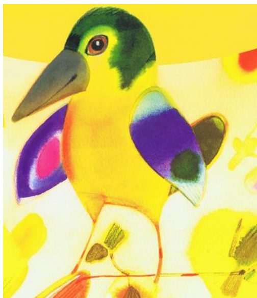
«Der Chamäleonvogel» begleitet Kinder ab vier Jahren in die Geschichte rund um Ostern.

Evangelisch-reformierte Kirchgemeinde Mittleres Toggenburg