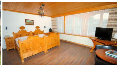
Zimmer im Hotel Victoria

Am Morgen beginnen wir mit einer Andacht in der reformierten Dorfkirche direkt neben dem Hotel. Jeden Tag werden Ausflüge oder Aktivitäten angeboten.