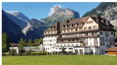
Hotel Victoria mit Park

Wohnen werden wir im Belle Époque Hotel Victoria . Es liegt mitten im Zentrum von Kandersteg und ist von einem grossen Park umgeben. Der ideale Ort zum Ausspannen und Auftanken. Es bietet auch einen Wellness-Bereich mit Hallenbad, Dampfbad, Infrarotkabine und Fitnessraum, die gratis benutzt werden können.