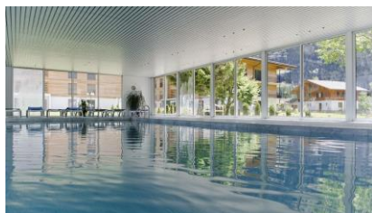
Hallenbad im Hotel Victoria