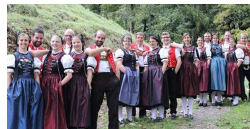
Das Bergsonnehörli Mosnang.