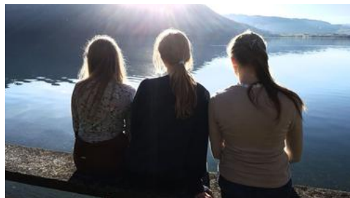
Drei Mädchen am Ägerisee.

Die Anmeldefrist ist auf den 15. November gesetzt, damit wir gut planen können. Der Anlass