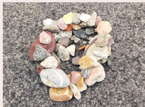
Einige kreative Kinder bauten von sich aus eine Kirche aus Steinen.

Um weiterhin mit den Schülern in Kontakt zu bleiben, ohne diese mit zusätzlichen Aufgaben zu belasten, wurde von verschiedenen Lehrpersonen ein kleiner Ostergruss an alle Kinder und Jugendlichen verschickt. Diese Osterbriefe waren stufengerecht gestaltet, beispielsweise mit Ausmalbildern, Rätseln und einer Ostergeschichte für die 1. und 2. Klässler, Bastelvorlagen und eine Kinderzeitschrift mit dem Thema Corona, für die etwas grösseren Kinder. Auch wurden Rezepte für das Brotbacken ohne Hefe verschickt sowie für essbare Kräuter in unserer