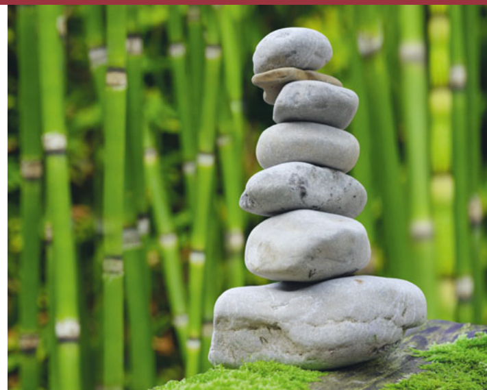
Das Lagermotto des KidsCamps 2020 lautet: «Stei uf üsene Wäg».