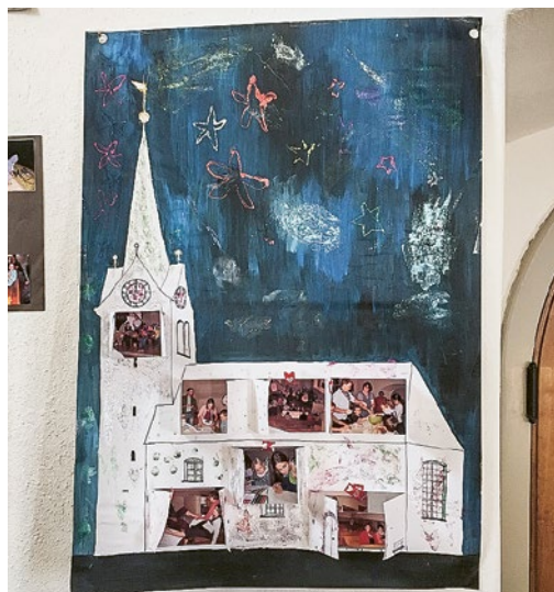
Die Krinauer Kirche mit offenen Türen und Fenstern von der Nacht der «Leuchtenden Kirche».

Am Ostermorgen ist der Stein vor dem Grab von Jesus weggerollt – die Tür zum Leben geht auf. In der Kirche Krinau hängt seit der Nacht der «Leuchtenden Kirche» eine Kirche mit offenen Türen und Fenstern. Was passiert, wenn wir Türen öffnen?