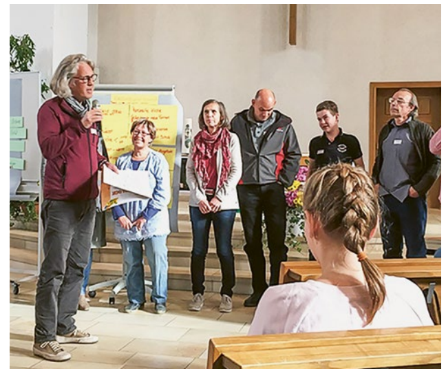
Zukunftskonferenz im November 2017: Der Kickoff-Anlass am 16. März ist die Fortsetzung.

Man kann am Kickoff-Anlass auch noch neue eigene Themen für eine AG einbringen. Und man kann auch an den Anlass kommen, wenn man nicht in einer AG mitmacht und wenn man nicht an der Zukunftskonferenz war. Alle, die sich für die Zukunft der Kirchgemeinde interessieren, sind herzlich willkommen!