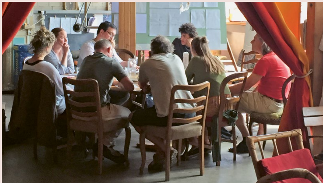
Die ökumenische Erwachsenenbildung bei einem Treffen: Eine gesellige Diskussions-Atmosphäre.

Am Samstag, 22. September, von 10 bis 14 Uhr, lädt die ökumenische Erwachsenenbildung und die mini.wirkstadt zur «Un-Konferenz» in Lichtensteig ein. Seien Sie dabei.