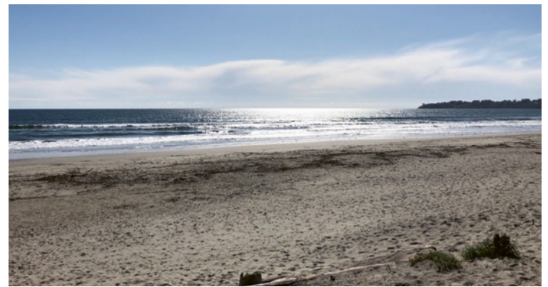
Den Horizont erweitern - aber auch im Toggenburg bleibt die Welt nicht stehen: Eine Erfahrung aus dem Studienurlaub.