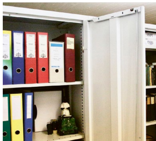
Das Krinauer Archiv am neuen Ort in Lichtensteig.